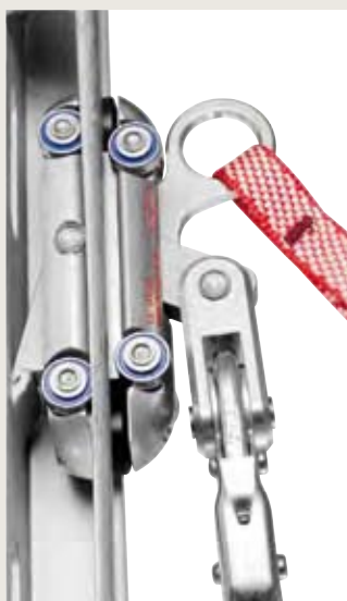
Sperrklinke A und B arretiert