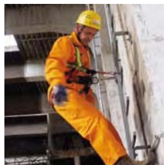
Die Person kann sich ohne fremde Hilfe in die ursprüngliche Ausgangsposition zurückbefördern und ihren Auf- oder Abstieg fortsetzen.

RAILSTOP RS S 05 stoppt Stürze schon im Ansatz und vermeidet lebensbedrohliche Situationen, ohne dass sich der Nutzer in seinen Bewegungen einschränken muss.