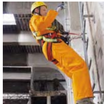
Person macht mit dem Oberkörper unkontrollierte Bewegung, Sperrklinke A arretiert nicht in der Führungsschiene. Sperrklinke B wird aktiviert.