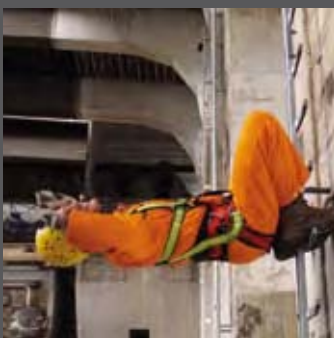
Fangeinrichtung bleibt dauerhaft entriegelt. Der Körper schlägt um und stürzt Kopf über nach unten.

Auch neuartige Fangeinrichtungen mit geschwindigkeitsabhängiger Sperrfunktion bieten keinen Schutz: Die Person wird mit dem Kopf nach unten aufgefangen. LEBENSGEFAHR!