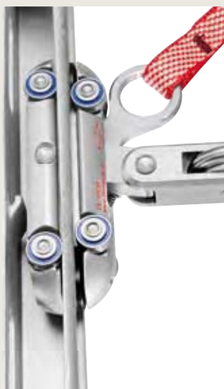
Sperrklinke A und B frei