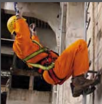
Person kippt nach hinten und fällt ungebremst nach unten.