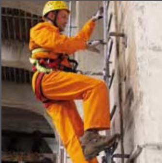
Aufstieg mit normaler Fangeinrichtung