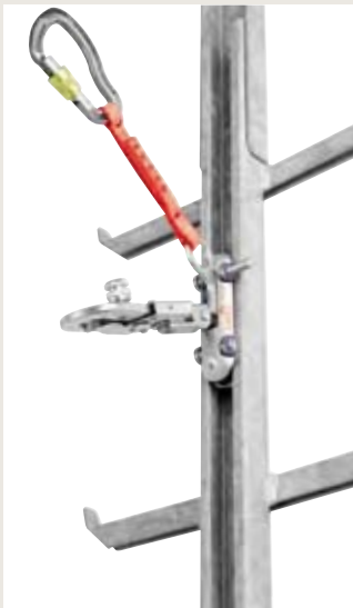
Normalposition, beim kontrollierten Steigen

Die BORNACK Fangeinrichtung RAILSTOP RS S 05 garantiert mehr als doppelte Sicherheit. Als vollredundantes System stoppt sie den Sturz schon in der Entstehung. Sie ist langlebig, äußerst komfortabel, ergonomisch durchdacht und kann kostengünstig nachgerüstet werden.