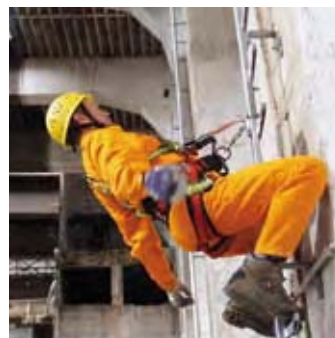
Sperrklinke B arretiert sofort und sicher in der Führungsschiene. Der Sturz wird gestoppt.