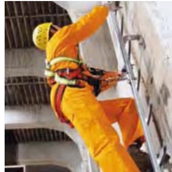
Aufstieg mit RAILSTOP RS S 05