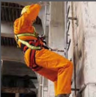
Person macht mit dem Oberkörper unkontrollierte Bewegung, Sperrklinke arretiert nicht in der Führungsschiene.