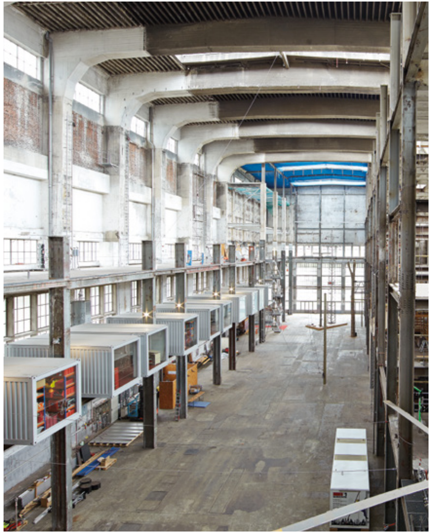
Das beeindruckende Trainings- und Eventzentrum HOCHWERK® in Marbach am Neckar.

Durch Toprope-Sicherung und unser geschultes Personal sind die Teilnehmer optimal gesichert und können das Höhenenerlebnis ganz entspannt genießen.